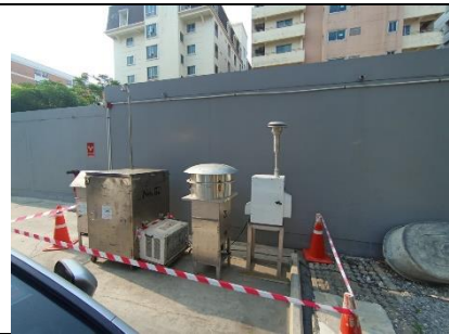
รูปที่ ผ7.85 การตรวจวัดคุณภาพอากาศในบรรยากาศ บริเวณอาคารชุดพักอาศัย (KAVE TOWN (Shift))