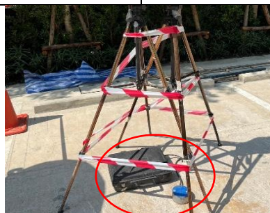
รูปที่ ผ7.88 การตรวจวัดความสั่นสะเทือน บริเวณพื้นที่โครงการ