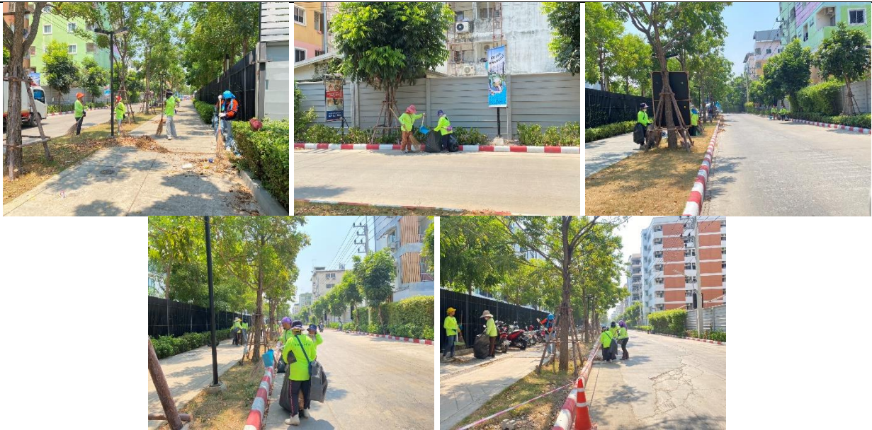
รูปที่ ผ7.83 กิจกรรมความรับผิดชอบต่อสังคม (Corporate social responsibility : CSR) ของโครงการ โดยจัดให้เจ้าหน้าที่คอยทำความสะอาดบริเวณถนนภาวะจำยอม ตลอดช่วงก่อสร้าง

ภาพถ่ายผลการปฏิบัติตามมาตรการป้องกันและแก้ไขผลกระทบสิ่งแวดล้อม และมาตรการติดตามตรวจสอบคุณภาพสิ่งแวดล้อม โครงการ เคฟ ทาวน์ ไอส์แลนด์ ประจำเดือนมกราคม-มิถุนายน 2567