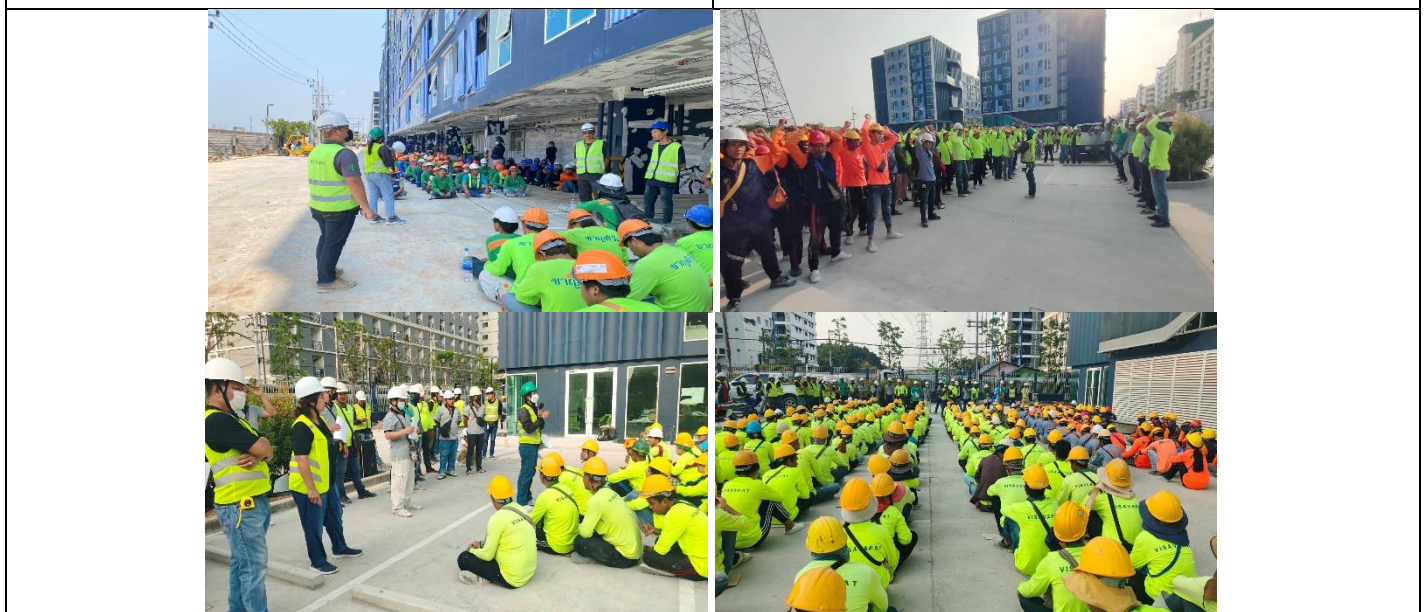
รูปที่ ผ7.80 Safety Talk ในช่วงก่อสร้าง