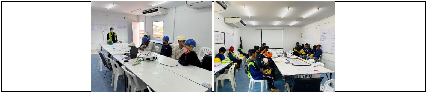
รูปที่ ผ7.77 การอบรมให้ความรู้ในการทำงานแก่เจ้าหน้าที่และคนงาน ในช่วงก่อสร้าง

ภาพถ่ายผลการปฏิบัติตามมาตรการป้องกันและแก้ไขผลกระทบสิ่งแวดล้อม และมาตรการติดตามตรวจสอบคุณภาพสิ่งแวดล้อม โครงการ เคพี ทาวน์ ไอส์แลนด์ ประจำเดือนมกราคม-มิถุนายน 2567