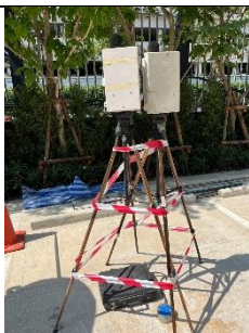
รูปที่ ผ7.86 การตรวจวัดระดับเสียงในบรรยากาศ บริเวณพื้นที่โครงการ