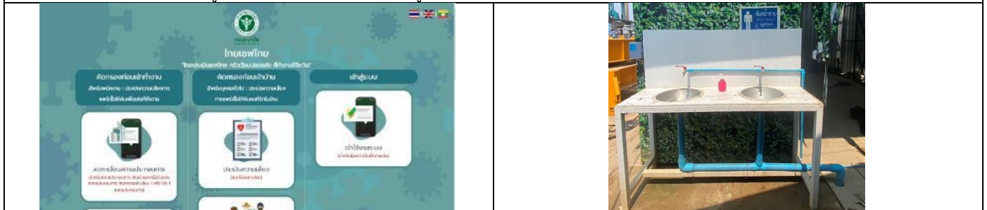
รูปที่ ผ7.78 แอปพลิเคชัน Thai Save Thai สำหรับให้คนงานประเมินตัวเองก่อนออกจากที่พัก ในช่วงก่อสร้าง