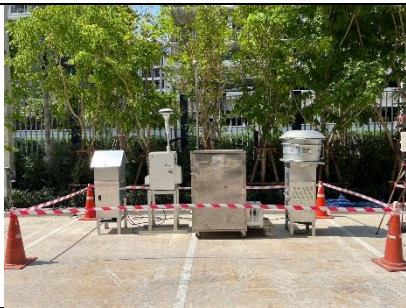
รูปที่ ผ7.84 การตรวจวัดคุณภาพอากาศในบรรยากาศ บริเวณพื้นที่โครงการ