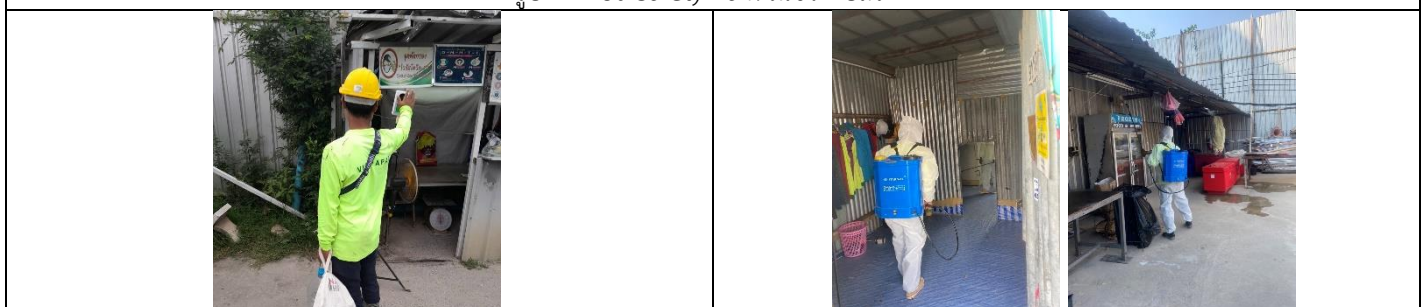
รูปที่ ผ7.81 จุดคัดกรองคนงานก่อสร้างก่อนเข้าพื้นที่บ้านพักคนงาน