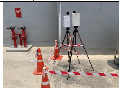
รูปที่ ผ7.87 การตรวจวัดระดับเสียงในบรรยากาศ บริเวณอาคารชุดพักอาศัย (KAVE TOWN (Shift))